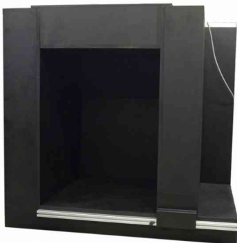
5 Ebene – Einbau Geräte