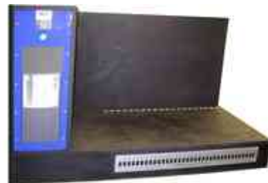
1 Ebene – Flache Produkte